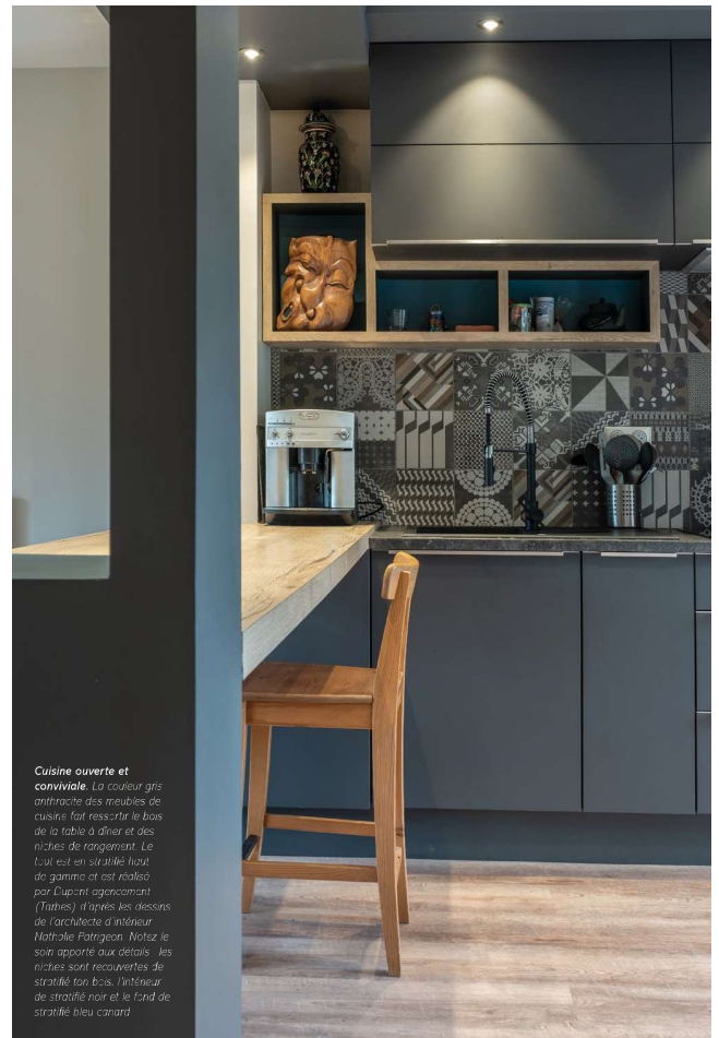
Cuisine ouverte et conviviale. La couleur gris anthracite des meubles de cuisine fait ressortir le bois de la table à dîner et des niches de rangement. Le tuil est en stratifié haut de gamme et est réalisé par Dupont agencement (Tarbes) à travers les missions de l'architecte d'intérieur Nathalie Patrigeon. Notez le soin apporté aux détails : les niches sont recouvertes de stratifié ton bois, l'intérieur de stratifié noir et le fond de stratifié bleu canard.

Gros œuvre, placo, carrelage : Auguste Pérois (Auzanville). Électricien : Lysabellot (Toulouse). Plombier : Frasson et Fil (Frouzins). Menuiseries extérieures : Sampo (L'Union). Peinture, revêtements de sol : Lecroix (Tarbes). Menuisier (cuisine, meubles de salle de bains, dressing, habillage escalier) : Dupont agencement (Tarbes).