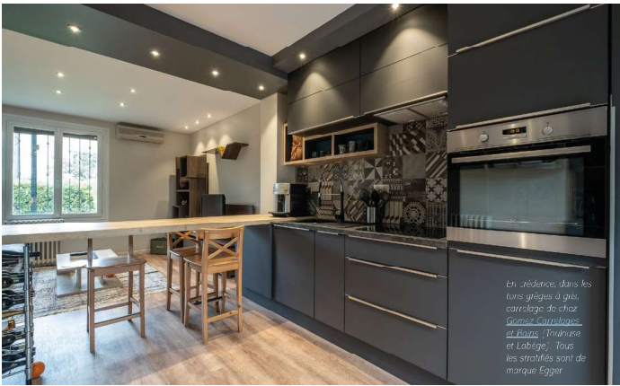
En référence dans les tons grisés à gris, carrelage de chez Egger. Carrelages, du Blanc, Truisme et Labège. Tous les stratifiés sont de marque Egger.