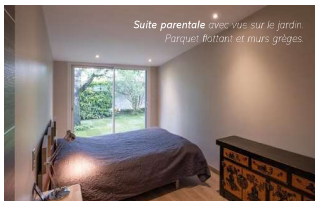
Suite parentale meublée sur le jardin. Parquet flottant et murs grisés.