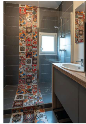
Dans la salle de bains des enfants des motifs mexicains forment un chemin de couleurs qui va de l'entrée jusqu'au plafond. Carrelage gris anthracite aux murs, antidérapant au sol. Mobilier en stratifié Egger.