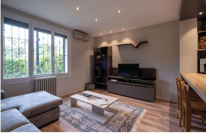
Ambiance chaleureuse et cosy dans le salon.