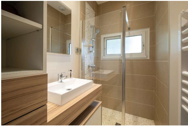
Salle de bains parentale. Malgré une faible largeur disponible, l'architecte d'intérieur a créé un espace très agréable. Galets au sol de la douche à l'italienne comme derrière la colonnade de douche, carrelage beige de 60x30cm au mur, l'assorti au sol.