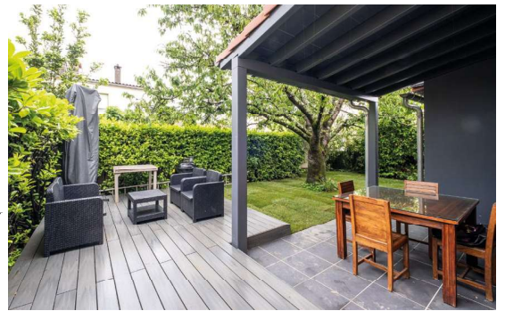
Se réapproprié le jardin. La terrasse est sur 2 niveaux : la partie haute en bois composite pour le salon de jardin, la partie basse carrelée pour les repas, protégée par l'appentis.