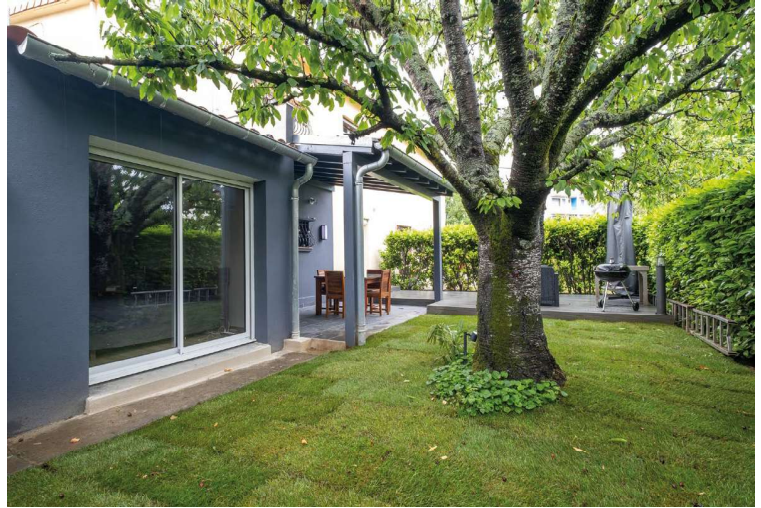
Les modifications de façades... en gris ! L'ancienne la base vitrée se trouve la suite parentale du 1 er étage, installée dans l'ancien garage complètement transformé. Au second plan la fenêtre, sous l'appentis créé par l'architecte, donne sur le collier.